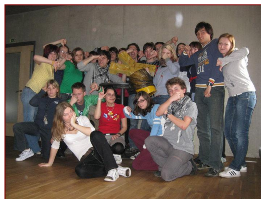
Demonstrace proti demonstraci za barevný plášť knihovny