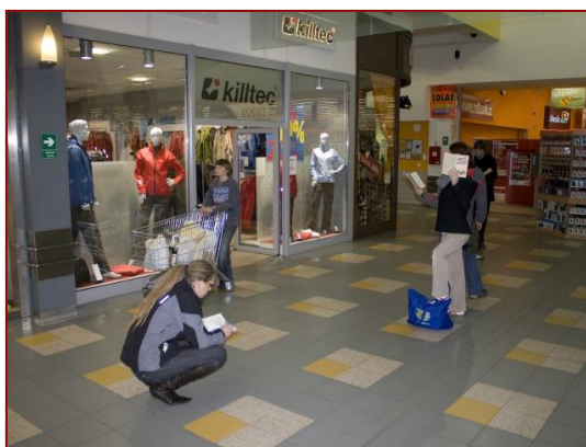
Frozen Motion v obchodním domě