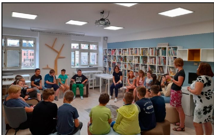
Nový interiér dětského oddělení Městské knihovny v Broumově při čtenářské lekci pro školu