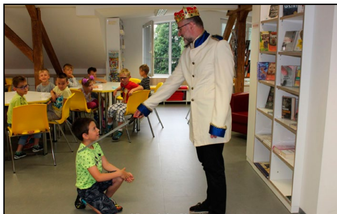
Pasování na čtenáře v Obecní knihovně Předměříce nad Labem (okr. Hradec Králové)