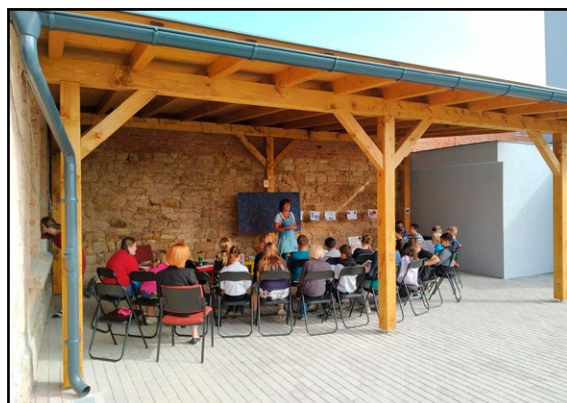
Nově vybavený knihovní dvorek v Hořicích v Podkrkonoší