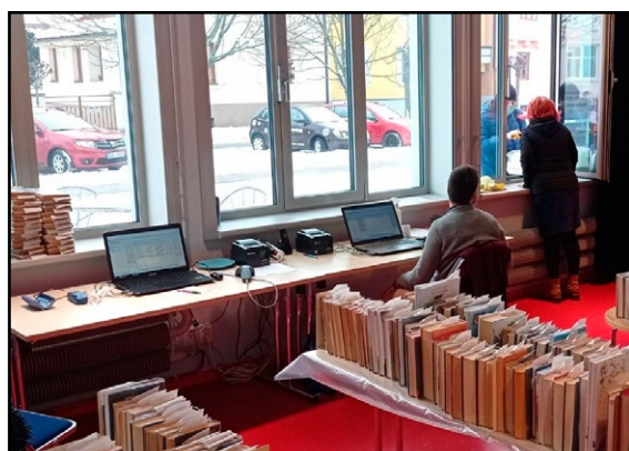
Na snímku je zachycen „výpůjční pult“ v Knihovně města Hradce Králové

Kulturní, vzdělávací a komunitní akce nejčastěji odrážely snahu knihovníků přilákat návštěvníky ke čtení a rozvíjet ve spolupráci se školami čtenářskou gramotnost dětí a mládeže. K pořádání akcí byly v sezóně využívány venkovní prostory, což bylo pro návštěvníky atraktivní a zároveň vyhovovalo zdravotním opatřením.