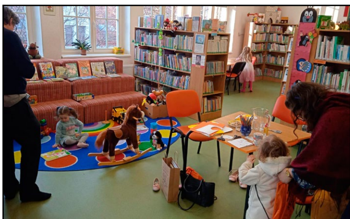
Knihovna V. Čtvrtka v Jičíně připravuje v rámci programu Bookstart Čtípiskova klubka a klubička v prostorách dětského oddělení