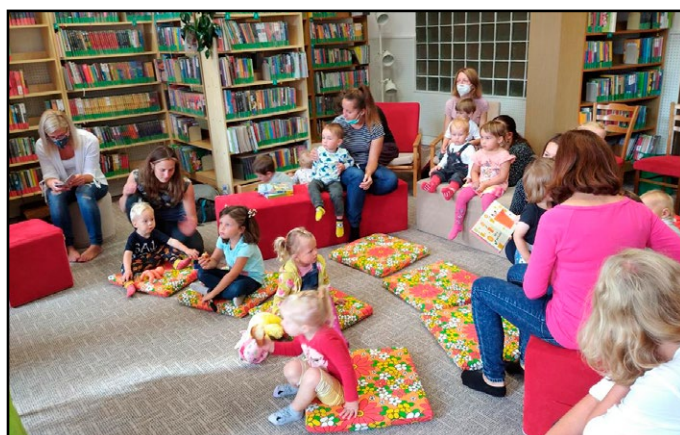
Knížkárna pro nejmenší v Městské knihovně Hořice