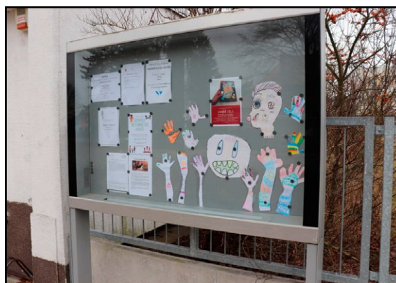
Venkovní výstavní plocha Místní knihovny v Černilově (okr. Hradec Králové)