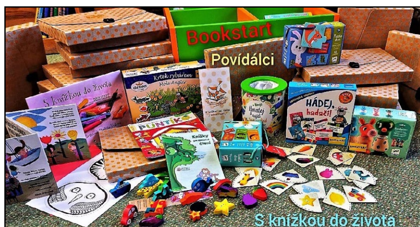
Ilustrace k projektu Bookstart z Městské knihovny v Trutnově