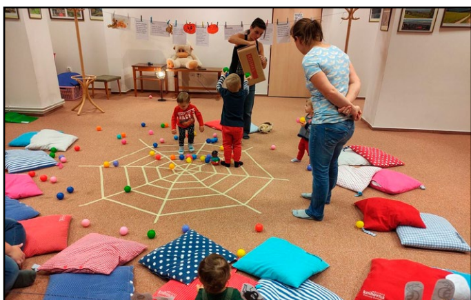
Nejmenší návštěvníci v Knihovně B. Kafky v Červeném Kostelci