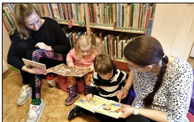
Výchova ke čtenářství v Městské knihovně Trutnov