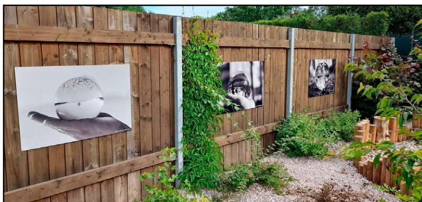
Knihovna Břetislava Kafky v Červeném Kostelci rozšířila své prostory o knihovní zahradu. Zahrada příběhů je vybavena pro pořádání venkovních akcí i výstav, nabízí místa ke klidnému čtení i herní prvky pro děti.