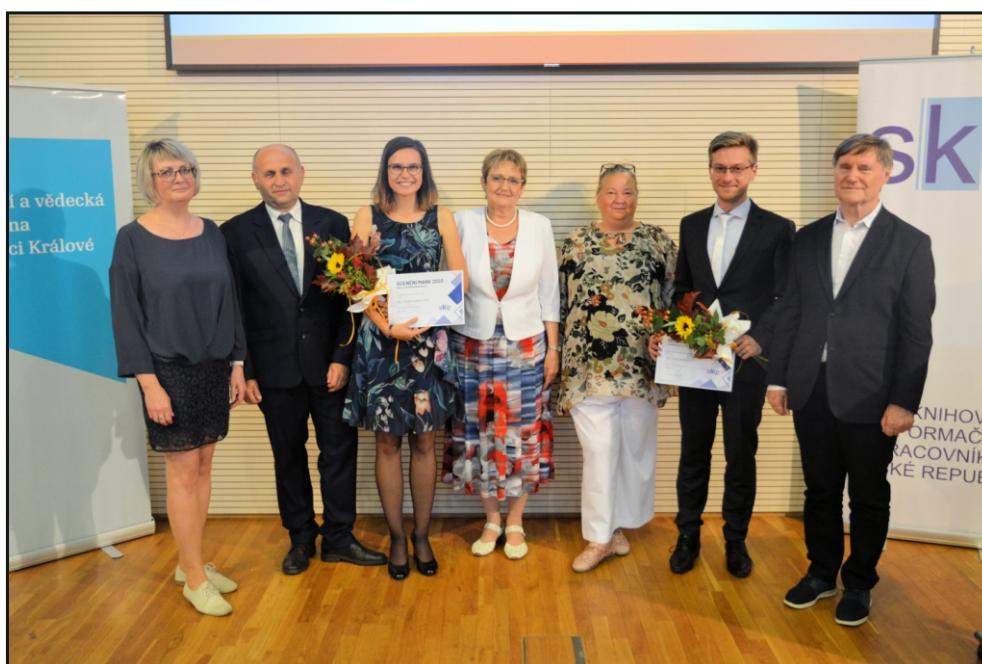
Ocenění MARK – mladí pracovníci královéhradeckých a pardubických knihoven se zástupci knihovny, která je nominovala, představiteli kraje a knihovnické obce, kteří předávali ceny.

https://www.svkhk.cz/Pro-knihovny/Zpravodaj-U-nas/Clanek.aspx?id=20230413