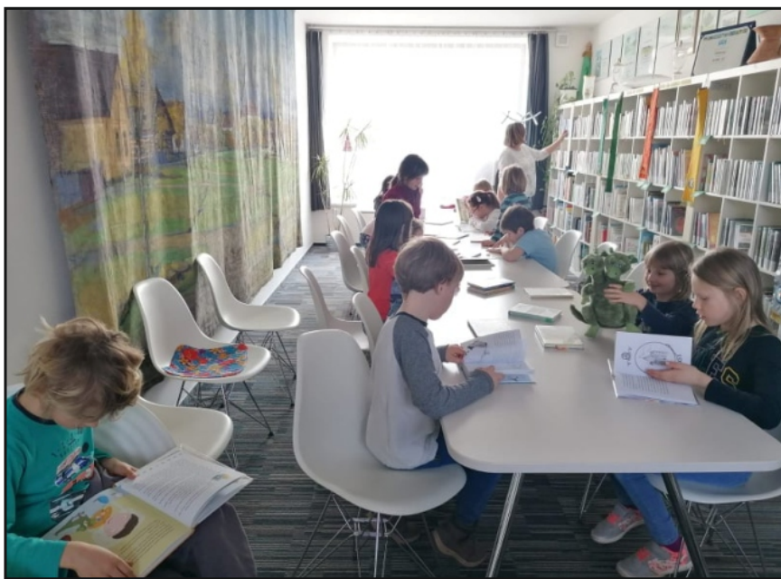
Vítěz druhého ročníku soutěže Knihovna roku Královéhradeckého kraje 2023 – Místní knihovna Holovousy

Medailonky knihoven, které se zúčastnily soutěže, naleznete v časopise U nás, číslo 3 a 4 ročníku 2023, který je dostupný i na webových stránkách: https://www.sv-khk.cz/Pro-knihovny/Zpravodaj-U-nas/Archiv-cisel.aspx .