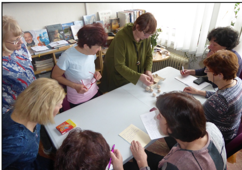
Akce pro seniory v Městské knihovně Rtně v Podkrkonoší

Komunitní aktivity u neprofesionálních knihoven jsou individuální, liší se místo od místa. Velký vliv má jednak osobnost knihovníka, jeho časové možnosti, věkové a vzdělanostní složení obyvatel, dále prostorové možnosti knihovny a zásadní je i podpora ze strany obce. Ve více knihovnách našeho kraje jsou střediska Virtuální univerzity třetího věku při PEF ČZU v Praze, probíhají kurzy tréninků paměti, dále na mnohých místech probíhá ve spolupráci s knihovnou předčítání v domovech pro seniory.