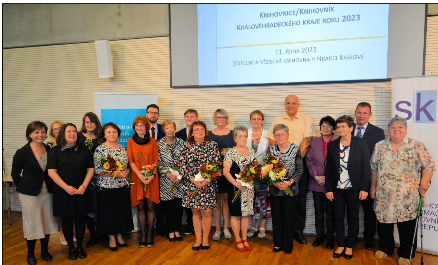
Oceněné knihovnice roku 2023 se zástupci své obce a představiteli kraje, města a knihovnické obce, kteří předávali ceny.

https://www.svkhk.cz/Pro-knihovny/Vzdelavani/Aktualni-vzdelavaci-akce/Clanky/UPR_Knihovnik_2023-(1).aspx