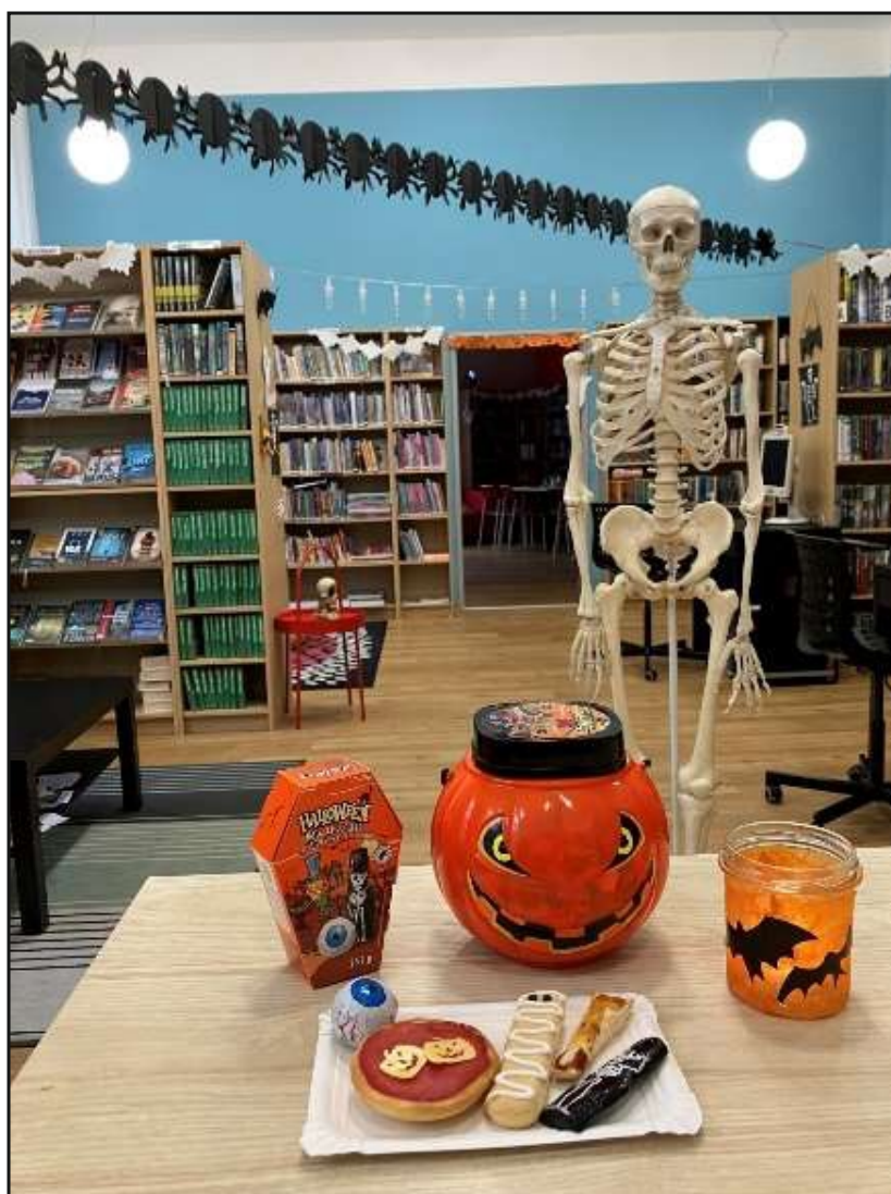
Halloween pro děti v Městské knihovně Teplice nad Metují

Velmi významnou podporou pro rodiny s dětmi je krajem podpořený projekt Bookstart, ve kterém je zapojeno 58 knihoven našeho kraje. Podrobnější zmínka k tomuto projektu je v kapitole Podpora Královéhradeckého kraje.