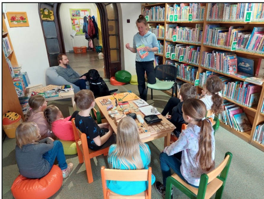
Akce pro děti uspořádaná se Sjednocenou organizací nevidomých a slabozrakých ČR, z.s. (SONS) v Městské knihovně Trutnov

Zrakově znevýhodnění celého kraje mohou využívat služby Zvukové knihovny pro nevidomé a slabozraké v Knihovně města Hradce Králové, která je pobočkou Knihovny a tiskárny K. E. Macana v Praze. K dispozici je jim speciální fond a služby: zvukové knihy pro děti a dospělé na CD a ve formátu MP3, kopírování na vlastní flash disky, zasílání zvukových knih zdarma, časopisy ve zvětšeném černetisku, čtecí technologie (PC s hlasovým výstupem, kamerové lupy), půjčování tyflopomůcek a her, odborně vyškolený personál, vzdělávací a kulturní pořady – např. Setkání s literaturou. Knihovna spolupracuje se Sjednocenou organizací nevidomých a slabozrakých ČR, z. s., (SONS) a obecně prospěšnou společností Tyfloservis a pořádají pro ně akce.