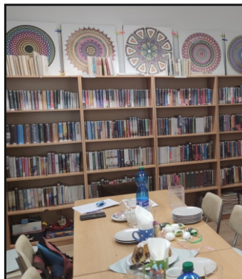
Třetí místo soutěže Knihovna roku KK – Knihovna Jaroslava City Vysokov