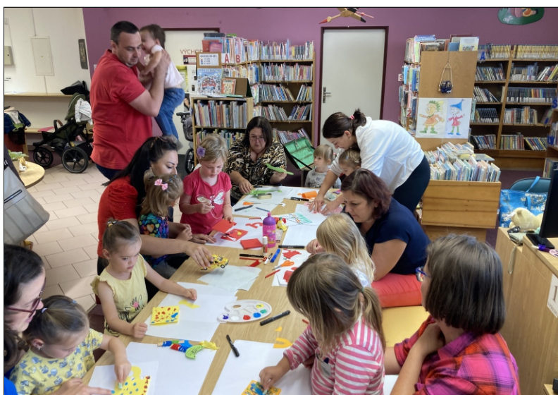
Akce Bookstart – prázdninové tvoření pro nejmenší v Městské knihovně Úpice

Komunitní aktivity rozvíjí a prohlubuje úspěšný projekt Bookstart – S knížkou do života, finančně podpořený Královéhradeckým krajem, kterého se v roce 2023 účastnilo 58 knihoven našeho kraje.