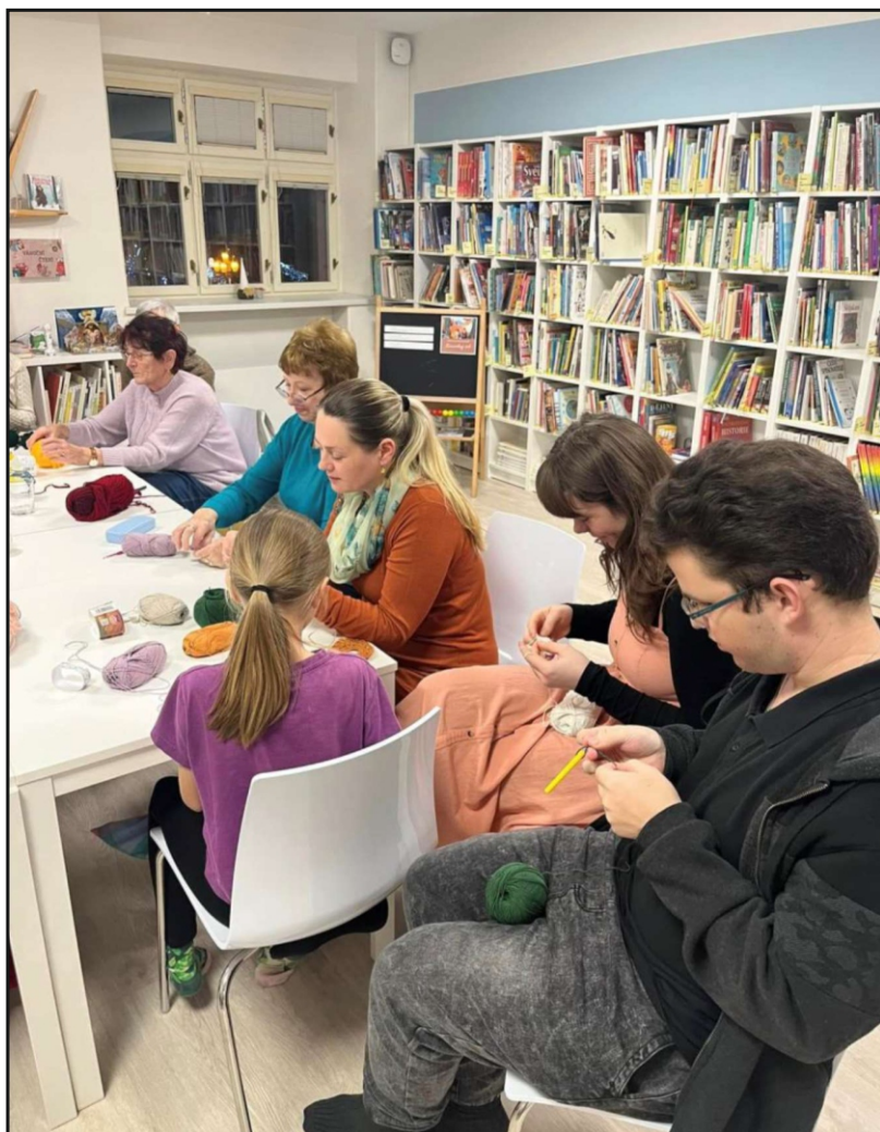
Háčkovací večer v Městské knihovně Broumov

Knihovna v Černilově rozšířila svou nabídku o novou službu semínkovny a probíhá zde i swapová výměna semen a sazenic.