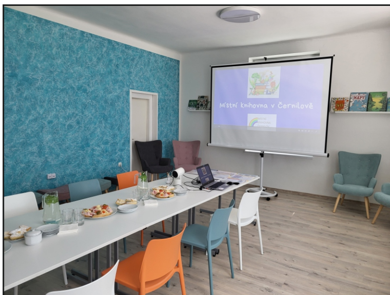
Zrekonstruovaný čtenářský sál Místní knihovny v Černilově

Kromě uvedených realizovaných dotačních projektů proběhly v kraji v roce 2023 další rekonstrukce knihoven. Například v okrese Hradec Králové byla dokončena výstavba multifunkčního domu ve Stračově, jehož součástí je i nová knihovna. Ve stejném okrese byla dokončena rekonstrukce objektu obecního úřadu v Blešně, kde se nachází i knihovna a pošta. Celkovou rekonstrukcí prošla knihovna v Zachrašťanech (též okres Hradec Králové). V okrese Náchod jsou po rekonstrukci prostory knihoven Nový Hrádek, Žďárky, Horní Rybníky.