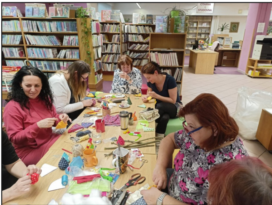
Výtvarná dílna pro ženy, která se uskutečnila v Městské knihovně Úpice

V Královéhradeckém kraji je z nabídky vzdělávacích, kulturních a komunitních aktivit největší zájem o cestovatelské besedy, dílničky pro děti se čtením, tvořivé dílny pro dospělé. V obcích, kde jsou mimo knihovny i školy nebo školky, jsou mezi nimi navázány spolupráce. Někde se spolupráce omezuje pouze na cca 1 návštěvu třídy v knihovně, ale jsou místa, kde je bohatá a akce jsou měsíční. Akcím a dalším aktivitám se daří hlavně tam, kde prostory knihovny prošly nějakou rekonstrukcí nebo vylepšením.