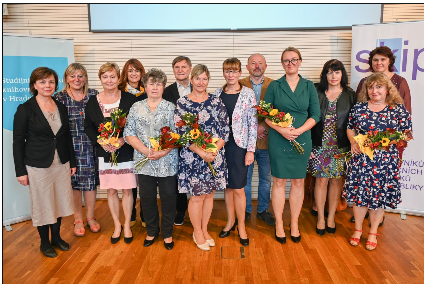
Zástupci oceněných knihoven v 2. ročníku krajské soutěže Knihovna roku Královéhradeckého kraje 2023 a představitelé kraje, města a knihovnické obce, kteří předávali ceny.

Za každý okres může v jednom roce nominaci získat nejvýše 1 knihovna z daného okresu. Další soutěžící knihovnou je na doporučení komise Vesnice roku knihovna, která zvítězila v této soutěži v kraji. Pravidla krajské soutěže respektují podmínky dané celostátní soutěží Knihovna roku, vítězná knihovna získává automaticky nominaci do celostátního kola soutěže Knihovna roku. Podrobné informace o výsledcích soutěže naleznete v kapitole Knihovnické soutěže a ocenění.