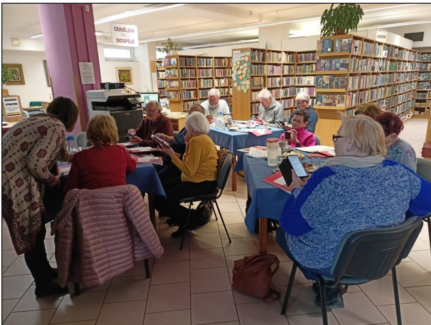
Akce Jak na chytrý telefon a tablet v Městské knihovně Úpice, uspořádaná ve spolupráci s neziskovou organizací Moudrá sovička