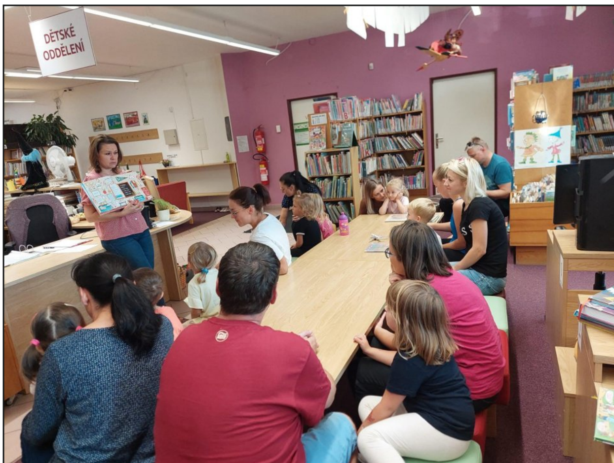
Akce Bookstart v Městské knihovně Úpice

V následující části kapitoly jsou shrnuty informace o komunitním a sociálním působení knihoven Královéhradeckého kraje, rozdělené podle toho, komu jsou určeny. Podrobnější přehledy aktivit realizovaných v knihovnách a příklady uspořádaných akcí jsou uvedeny ve výročních zprávách knihoven.