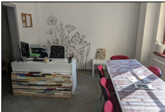
Druhé místo soutěže Knihovna roku KK – Obecní knihovna v Hejtmánkovicích

Medailonky knihoven, které se zúčastnily soutěže, naleznete v časopise U nás, číslo 3 a 4 ročníku 2023, který je dostupný i na webových stránkách: https://www.sv-khk.cz/Pro-knihovny/Zpravodaj-U-nas/Archiv-cisel.aspx .