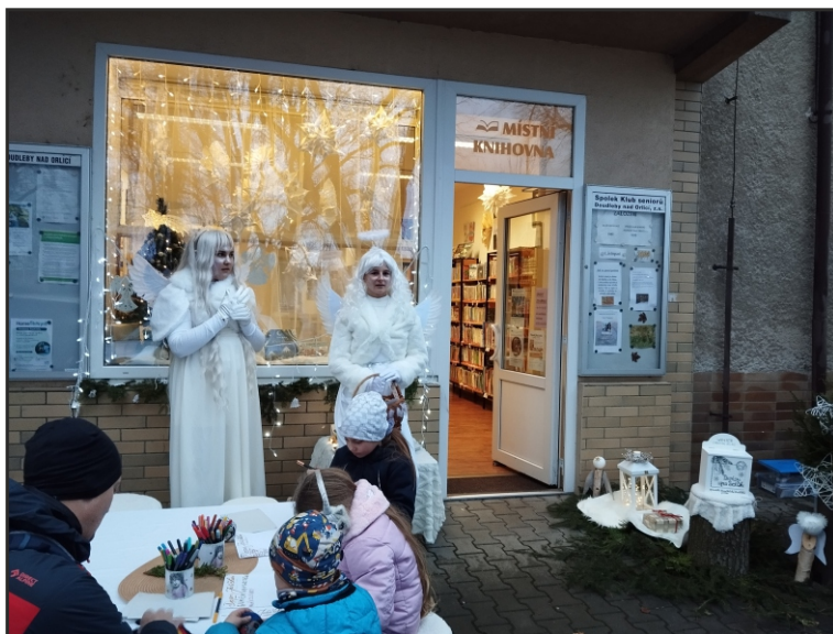
Adventní akce v Místní knihovně Doudleby nad Orlicí

Pro seniory je v knihovnách kraje ucelená nabídka služeb a vzdělávání. Pravidlem je finanční dostupnost, tedy registrace se slevou či zdarma. V mnohých knihovnách je k dispozici donášková služba, probíhají virtuální univerzity třetího věku, tréninky paměti, kurzy anglického jazyka, počítačové a další kurzy a dílny. Všechny přednášky jsou nabízeny se sníženým vstupným, knihovny se snaží o bezbariérovost. V některých knihovnách se mohou senioři zúčastnit vzpomínkových poslechových pořadů, šachového klubu, čtenářského kroužku. Jsou pořádány i akce pro knihovnické seniory (organizuje je seniorská sekce SKIP 08). Hodně knihoven pořádá akce ve spolupráci s neziskovou organizací Moudrá sovička; jedná se o edukační programy pro seniory 65+, které mají za cíl naučit je zábavnou formou seminářů správně a bezpečně ovládat chytré telefony, tablety i počítače a využívat všechny jejich dostupné funkce a na ně navazující aplikace. Při oslavách Svátku seniorů, které pořádal Královéhradecký kraj a doprovázel je bohatý kulturní program, měly knihovny kraje svůj stánek, kde představily služby určené seniorům.