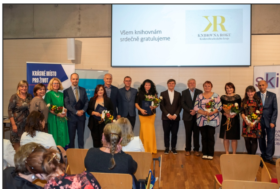
Zástupci oceněných knihoven v 3. ročníku krajské soutěže Knihovna roku Královéhradeckého kraje 2024 s představiteli kraje, města a knihovnické obce, kteří předávali ceny

Za každý okres může v jednom roce nominaci získat nejvýše jedna knihovna. Další soutěžící knihovnou je na doporučení komise Vesnice roku knihovna, která zvítězila v této soutěži v kraji. Pravidla krajské soutěže respektují podmínky dané celostátní soutěží Knihovna roku, vítězná knihovna získává automaticky nominaci do celostátního kola soutěže Knihovna roku. Podrobné informace o výsledcích soutěže naleznete v kapitole Knihovnické soutěže a ocenění.