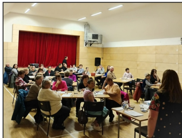
Lekce pro veřejnost v rámci Týdne trénování paměti v Obecní knihovně Loučice

Cílem je, aby se knihovna stala místem, kde se každý cítí vítaný, kde se lidé setkávají, učí, tvoří a kde je knihovna nejen půjčovnou knih, ale skutečným živým centrem obce.