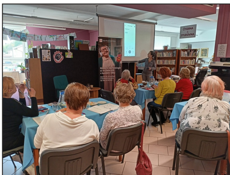
Akce Jak na chytrý telefon v Městské knihovně Úpice