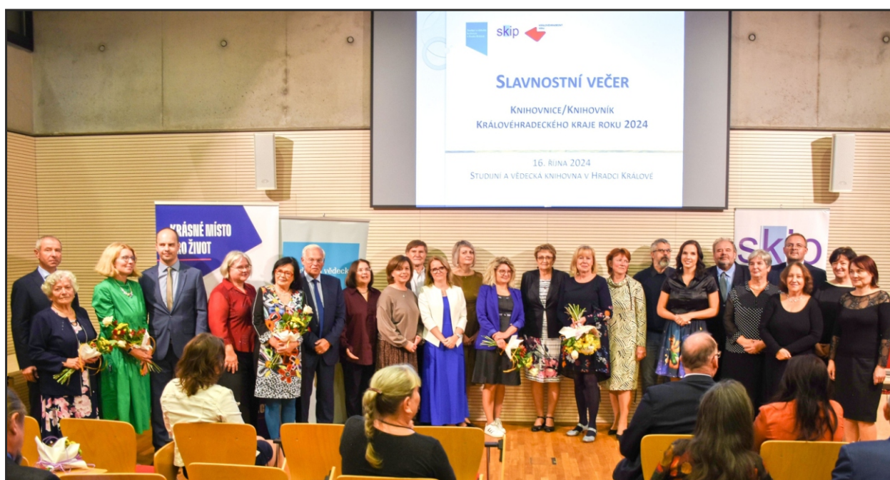
Společná fotografie zástupců oceněných knihoven v 3. ročníku krajské soutěže Knihovna roku Královéhradeckého kraje 2024 a oceněných knihovnic roku 2024 se zástupci své obce a představiteli kraje, města a knihovnické obce, kteří předávali ceny.

Po celý rok pokračovala podpora rozvoje čtenářství ze strany Královéhradeckého kraje poskytnutím individuální dotace na materiální zajištění projektu S knížkou do života – Bookstart. Centrum tohoto projektu je v Knihovně města Hradce Králové a celkově se ho účastnilo 72 knihoven z Královéhradeckého kraje.