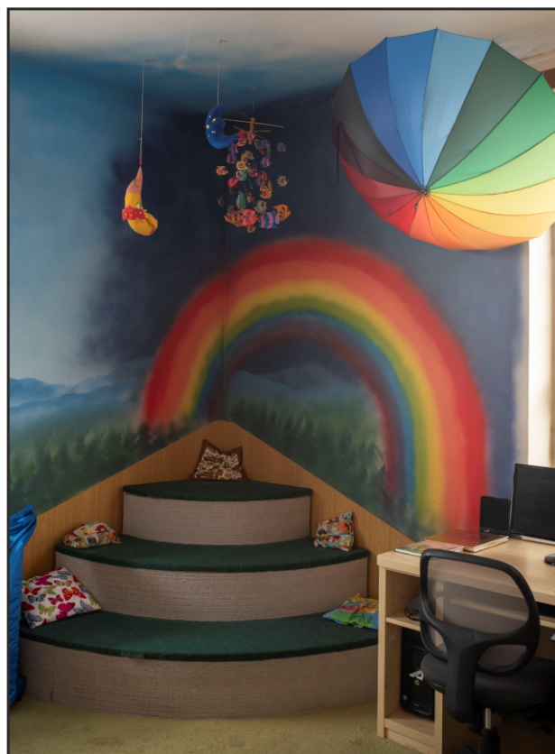
Vítěz třetího ročníku soutěže Knihovna roku Královéhradeckého kraje 2024 – Místní knihovna v Černilově

Medailonky knihoven, které se zúčastnily soutěže, naleznete v časopise U nás, číslo 3 a 4 ročníku 2024, který je dostupný na webových stránkách: https://www.svkhk.cz/Pro-knihovny/Zpravodaj-U-nas/Archiv-cisel.aspx .