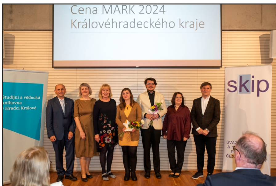
Ocenění MARK - mladí pracovníci královéhradeckých knihoven se zástupci knihovny, která je nominovala, představiteli kraje a knihovnické obce, kteří předávali ceny

Podrobnější informace o vítězi naleznete v časopise U nás, číslo 4 ročníku 2024, který je dostupný na webových stránkách: https://www.svkhk.cz/SVKHK/u-nas-pdf_archiv/20240416.pdf .