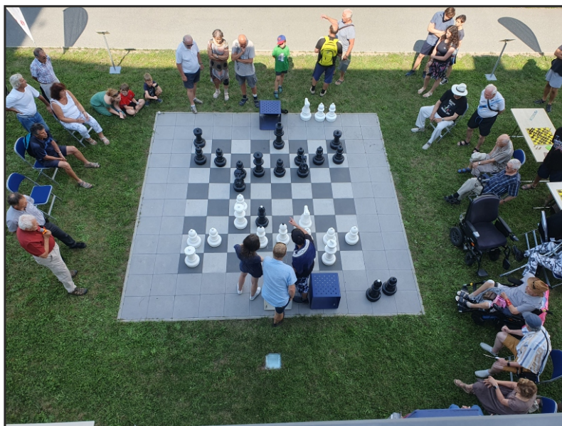
Akce před Knihovnou města Hradce Králové v rámci Mezinárodního dne šachu

V Královéhradeckém kraji je z nabídky vzdělávacích, kulturních a komunitních aktivit největší zájem o aktivity projektu S knížkou do života – Bookstart, cestovatelské besedy, regionální osobnosti, autorská čtení, dílničky pro děti se čtením, tvořivé dílny pro dospělé.