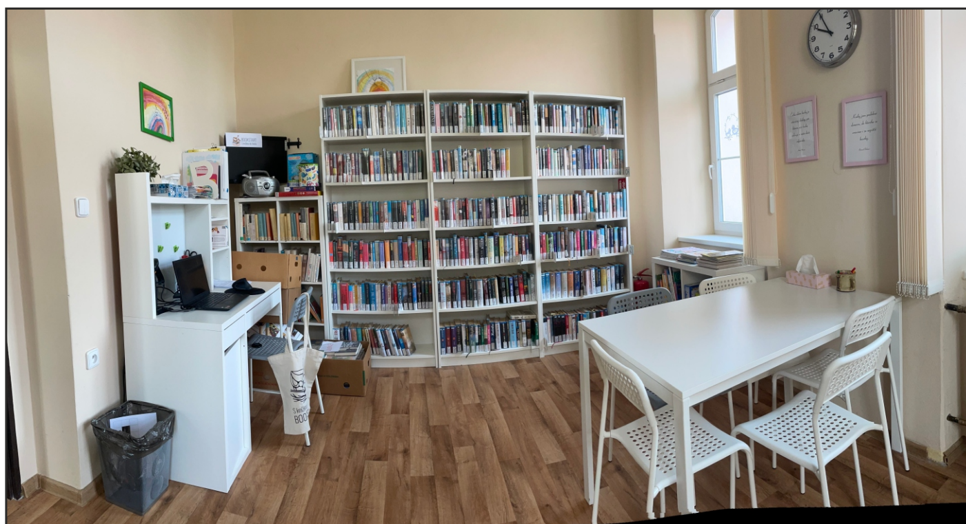
Třetí místo soutěže Knihovna roku Královéhradeckého kraje 2024 – Lidová knihovna Úlibice