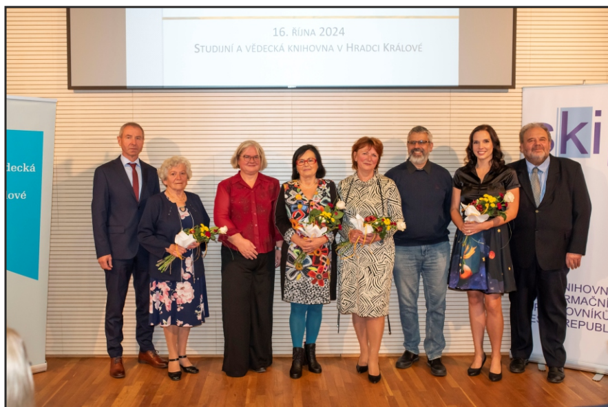
Oceněné knihovnice v kategorii Malé veřejné knihovny roku 2024 se zástupci své obce