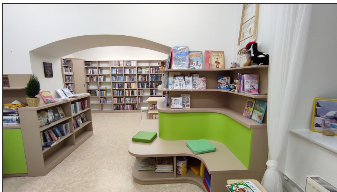
Nové vybavení knihovny ve Studnici z dotační podpory Královéhradeckého kraje

Dvě dotační výzvy v Programu obnovy venkova byly zdrojem zkušeností pro přípravu nového dotačního programu určeného přímo knihovnám. Samostatná dotační výzva určená přímo pro knihovny byla vyhlášena 17. června 2024. O výzvu byl ze strany knihoven značný zájem, podáno bylo 27 projektů, většina z nich byla podpořena. Na výzvu byly připraveny finanční prostředky ve výši 2 000 000 Kč.