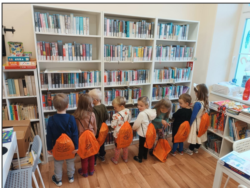
Akce pro děti v rámci projektu S knížkou do života – Bookstart v Lidové knihovně Útibice

Cílem projektu S knížkou do života je informovat rodiče o potřebě společného čtení s dětmi, a to prakticky od jejich narození, a dále také upozornit představitele státní správy a samosprávy na potřebu podporovat finančně i morálně tyto aktivity. V neposlední řadě je cílem projektu motivace knihoven pro práci stouptou skupinou uživatelů, seznámení příklady dobré praxe a inspirace pro pořádání společných aktivit rodičů s dětmi v knihovnách. Tento projekt několikátým rokem řídí Knihovna města Hradce Králové, a to bez finanční podpory z projektu.