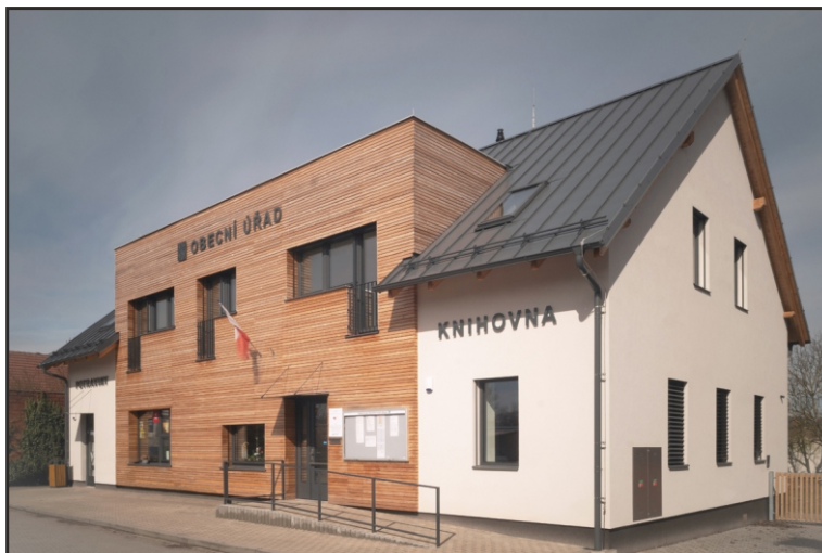
Obecní knihovna v Blešně

Počty bezbariérových knihoven se pomalu zvyšují. Dochází k tomu většinou při rekonstrukcích knihoven. Obce se obecně potýkají s nedostatkem vhodných prostor, kam by bylo možno knihovny umístit. Z tohoto důvodu nejsou knihovny vždy v těch nejvhodnějších prostorech. S tím souvisí i bezbariérovost. Knihovny v malých obcích jsou ve většině případů umístěny v budovách obecních úřadů.