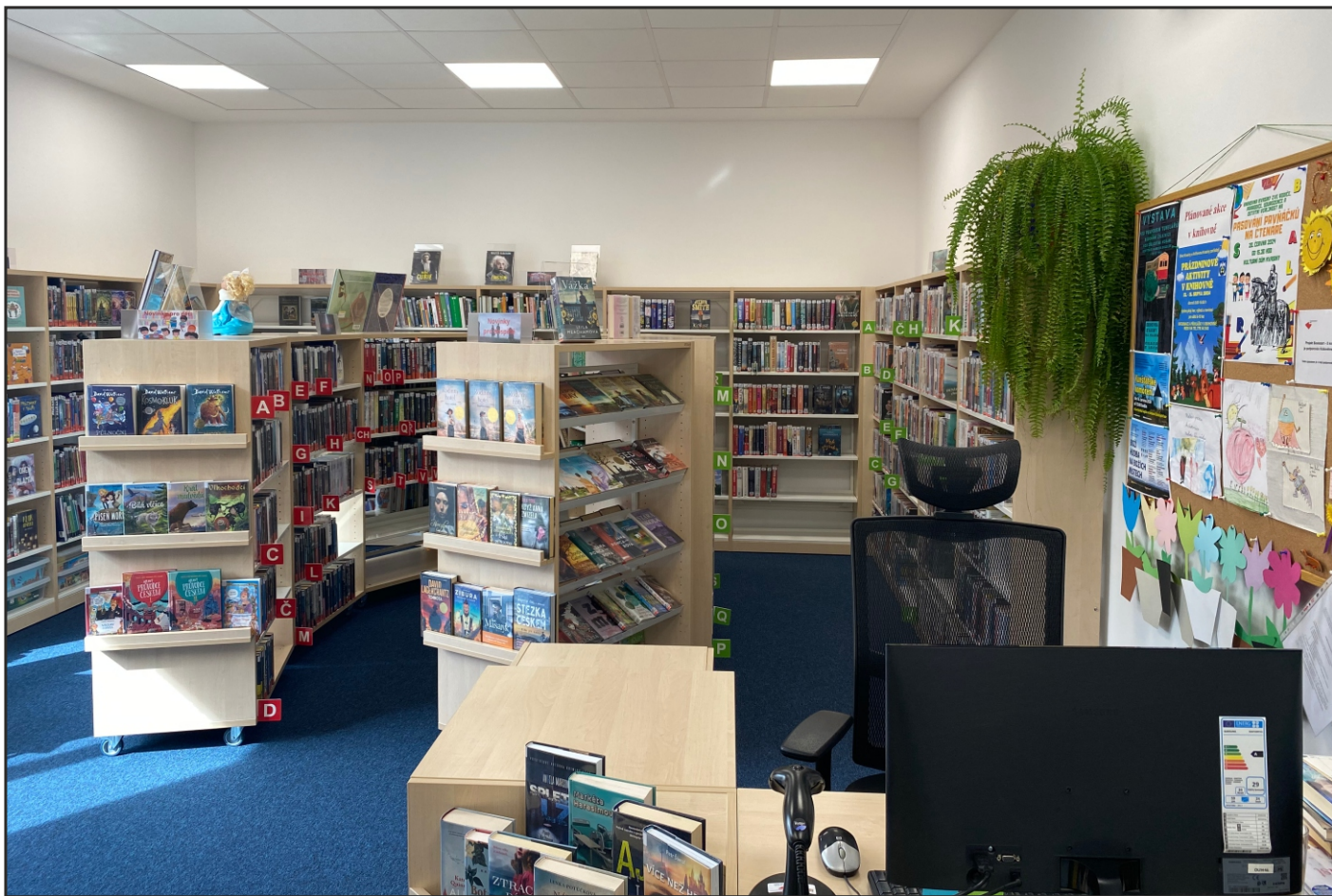
Druhé místo soutěže Knihovna roku Královéhradeckého kraje 2024 – Místní knihovna v Kvasinách