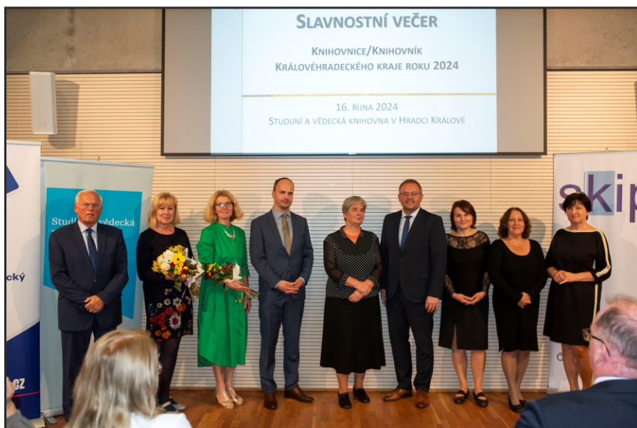
Oceněné knihovnice v kategorii Veřejné knihovny roku 2024 se zástupci své obce