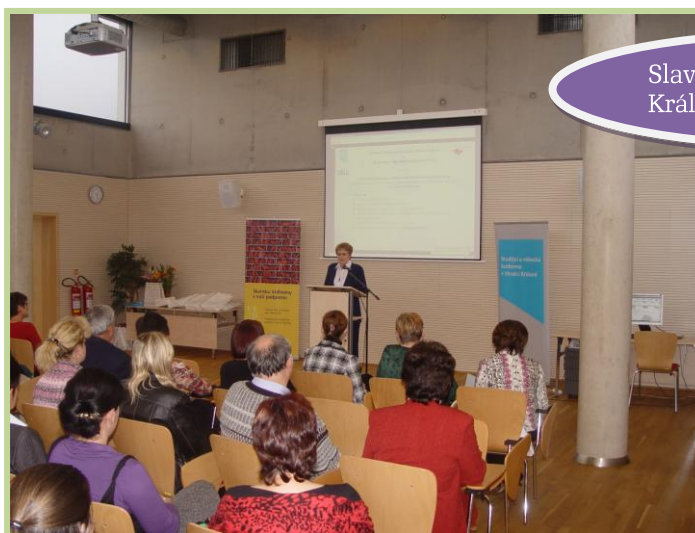
Slavnostní setkání knihovníků Královéhradeckého kraje