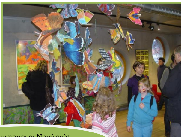
ZUŠ Habrmanova: Nový svět