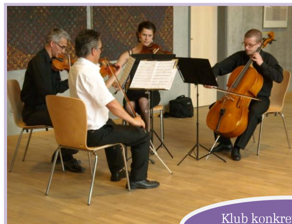
Klub konkretistů: 3 v 1 Vernisáž