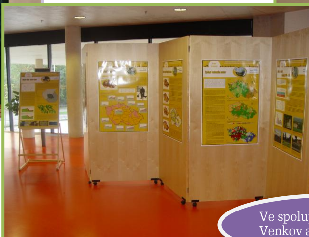
Ve spolupráci s PŘF UK: Venkov a venkované