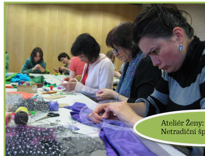
Ateliér Ženy: workshop Netradiční šperk